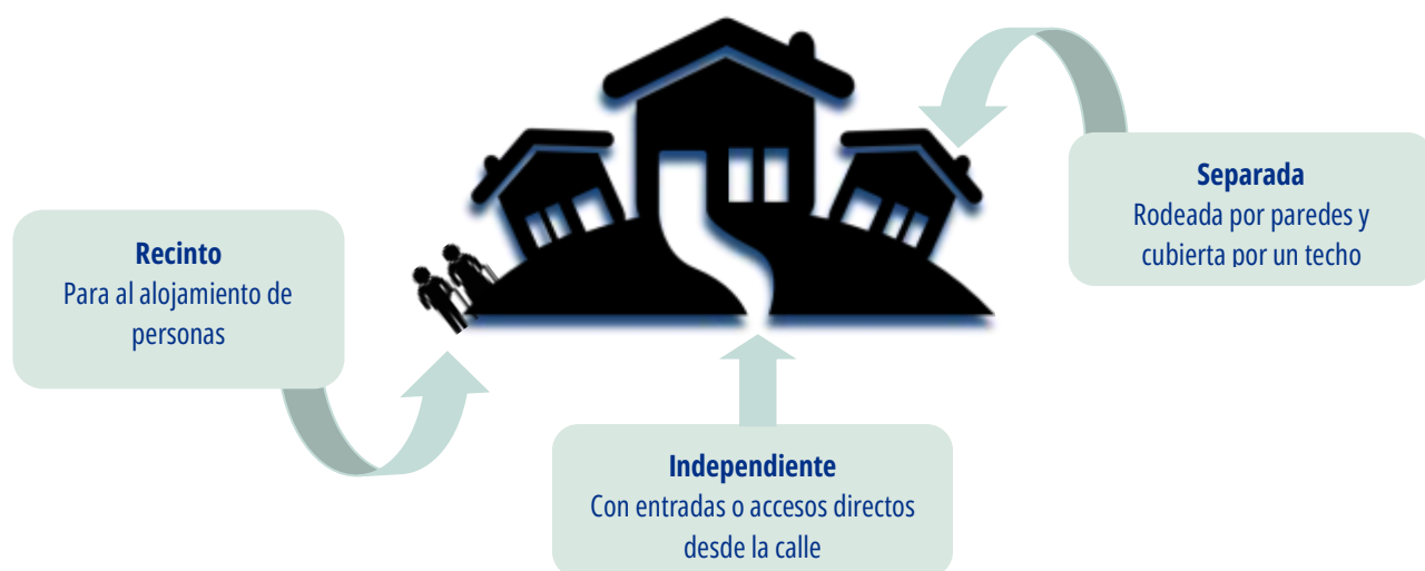
Figura 1. Características de las viviendas individuales

Por la metodología de la selección de las viviendas individuales, es poco probable que se entrevisten personas en viviendas móviles: como casas rodantes, buses, barcos, remolques u otros.