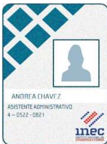
Figura 3. Presentación en la entrevista

“Buenos días/tardes/noches: Mi nombre es (diga su nombre y muestre el carné de identificación) soy entrevistador(a) del INEC y estoy realizando la Encuesta Nacional sobre Uso del Tiempo 2022. Quería solicitar su colaboración para llenar un cuestionario, ¿usted sería tan amable de concederme unos minutos