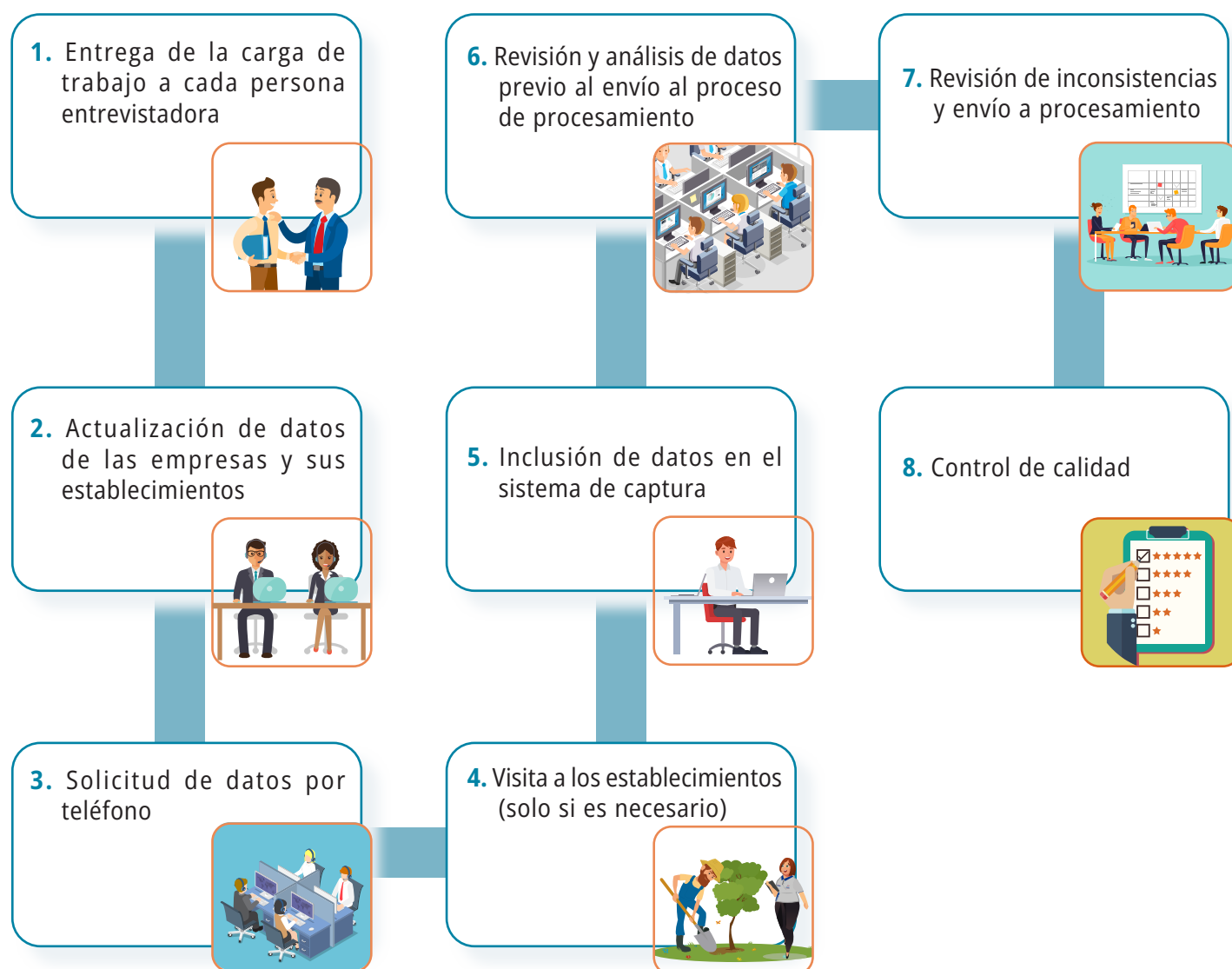
FIGURA 7.1 Costa Rica. Actividades de recolección de la Enadel

El proceso de recolección de datos incluyó todas las labores necesarias para hacer efectiva la participación de los establecimientos en la encuesta. Comprendió las labores que se muestran en la figura siguiente.