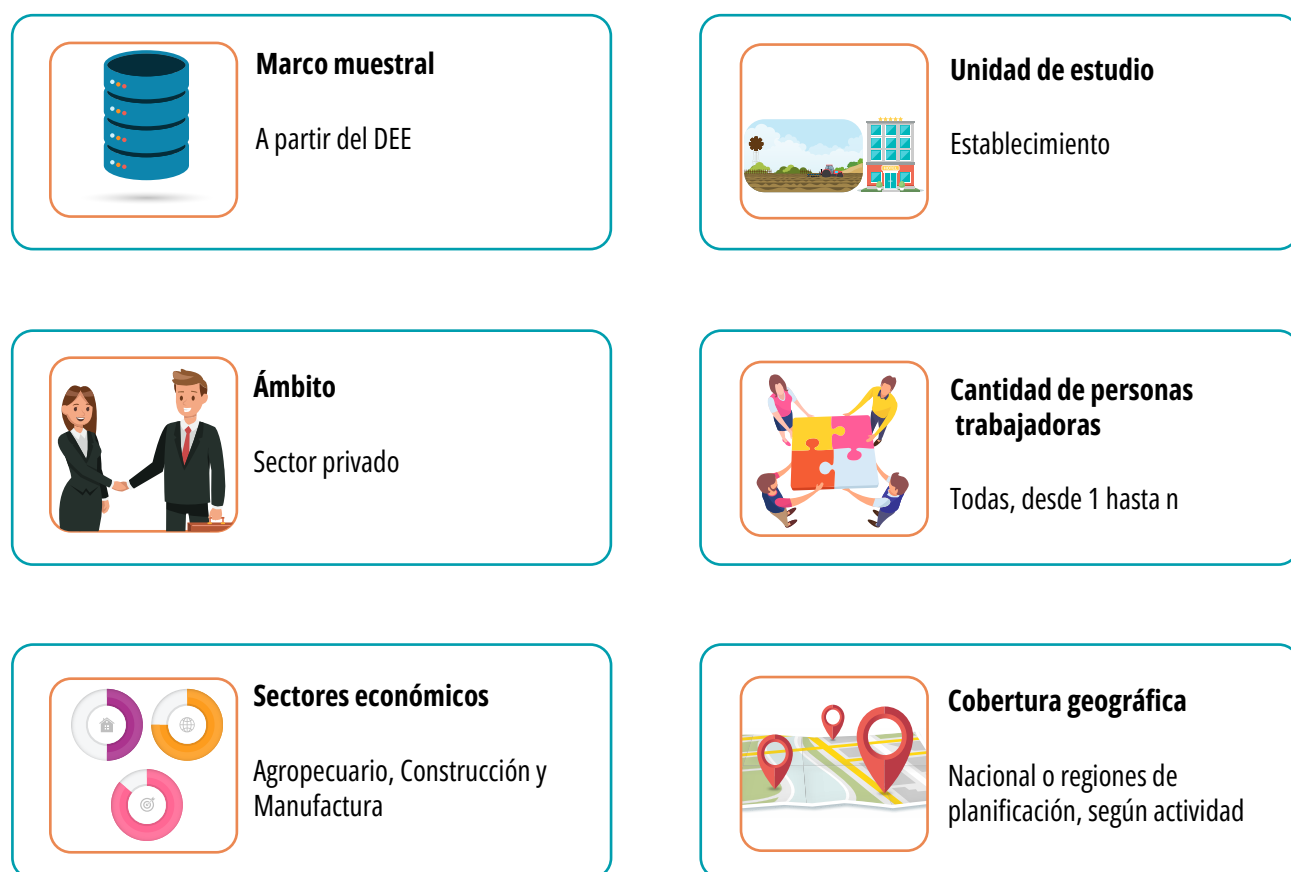
FIGURA 4.1 Costa Rica. Criterios de cobertura de la Enadel 2023